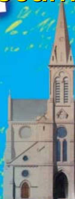
Projet d'église Saint-Martin. 1869