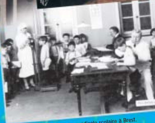
Visite médicale scolaire à Brest. 1928