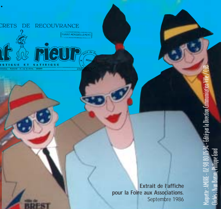
Extrait de l'affiche pour la Foire aux Associations. Septembre 1986

Maquette : AMIDE - 02 98 80 05 34 - Édité par la Direction Communication Ville / CUB Créatis : Yann Breton, Philippe Erard