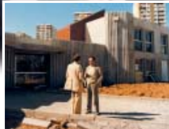
Groupe scolaire Nattier

Plantations d'arbres devant la Bibliothèque municipale de Pontanézen par les enfants du quartier avec l'aide des jardiniers municipaux en 1985.