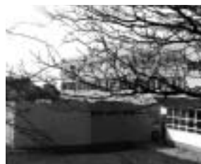
Groupe scolaire de Pen Ar Stréat