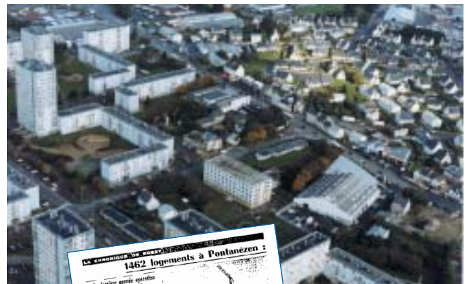
Vue aérienne de Pontanézen en octobre 1999

Ce groupe scolaire fait partie du programme triennal de construction HLM décidé en 1964. C'est l'architecte Claude Petton qui a dirigé le chantier, commencé en 1969.