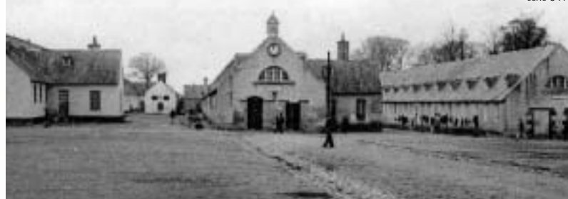
Soldats américains dans le camp de Pontanézen en 1917.

Carte postale (début du XX ème siècle)